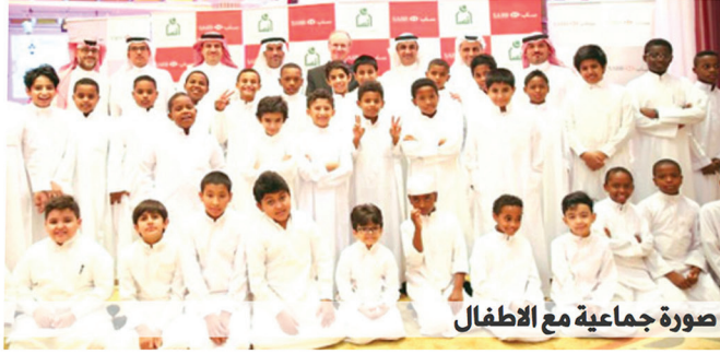
صورة جماعية مع الاطفال