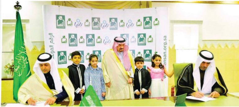
الرياض - واس

استقبل صاحب السمو الملكي الأمير فيصل بن بندر بن عبدالعزيز أمير منطقة الرياض رئيس مجلس إدارة الجمعية الخيرية لرعاية الأيتام "إنسان" في مكتبه بقصر الحكم أمس، مدير الجمعية الخيرية لرعاية الأيتام "إنسان" صالح بن عبدالله اليوسف، ورئيس مجلس إدارة شركة تانيا لمياه الشرب المعبأة شويبي بن عجيلان آل كتاب، وذلك لتوقيع اتفاقية تعاون مشترك بين جمعية "إنسان" وشركة "تانيا".