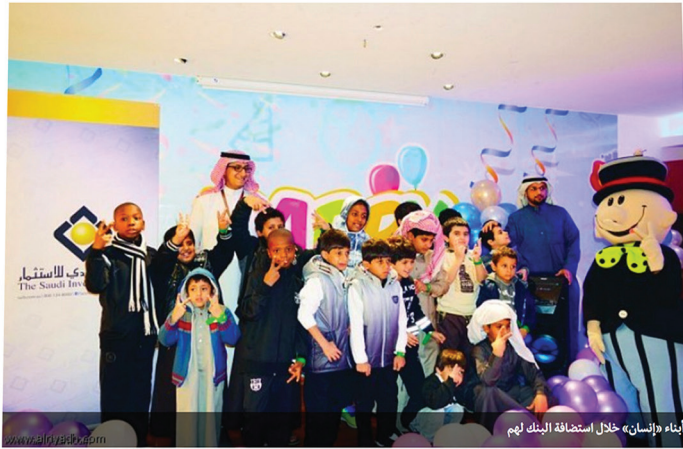
أبناء «إنسان» خلال استضافة البنك لهم

استضاف البنك السعودي للاستثمار 25 طفلاً من أطفال الجمعية الخيرية لرعاية الأيتام «إنسان»، في مدينة «مينوبوليس الترفيهية» بمركز حياة مول للتسوق بمدينة الرياض، حيث يعمل البنك على منظومة برامج وشراكات مجتمعية مع جمعية «إنسان» وعدد آخر من الجمعيات الخيرية لتعزيز أثر استثماراته في المجتمع ومواءمتها مع أهداف سياسة الرعاية والعون التي ينتهجها البنك.