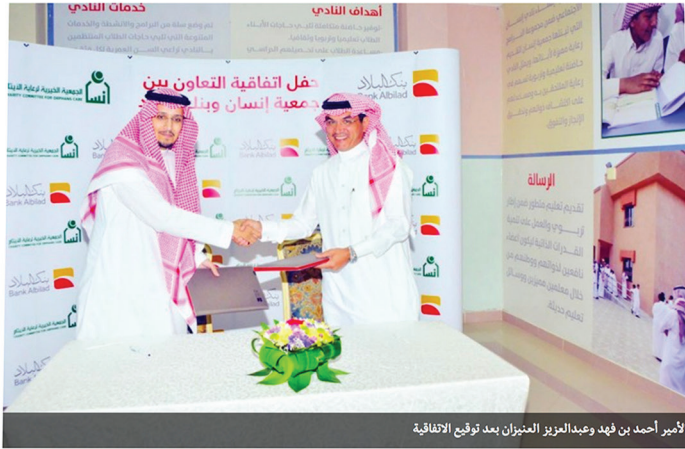
الأمير أحمد بن فهد وعبد العزيز العنيزان بعد توقيع الاتفاقية

وَقَّعَ بنك البلاد اتفاقية دعم لجمعية إنسان الخيرية بالرياض، لتقديم الرعاية للبوابة الإلكترونية التي يستفيد منها 41 ألف يتيم ویتيمة وأرملة بالرياض، وذلك ضمن برامج المسؤولية الاجتماعية لبنك البلاد، التي ينفذها البنك تحت مظلة برنامج «البلاد مبادرة» الموجه لخدمة المجتمع.