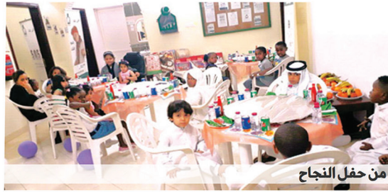
من حفل النجاح