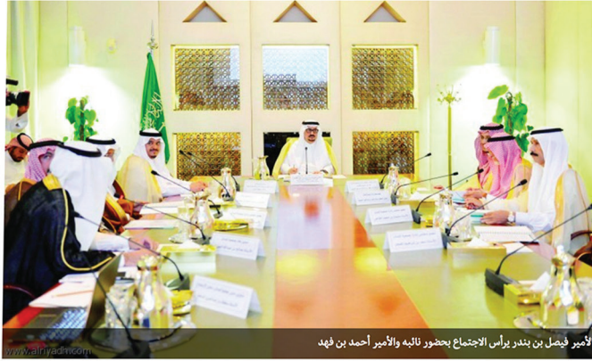
الأمير فيصل بن بندر يرأس الاجتماع بحضور نائبه والأمير أحمد بن فهد