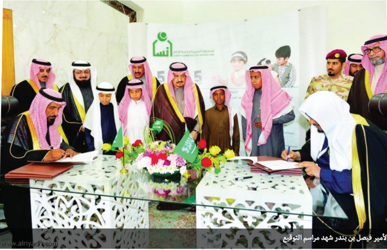
الأمير فيصل بن بندر شهد مراسم التوقيع